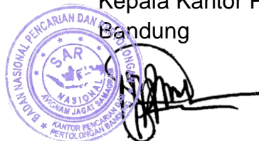
Jumaril, S.E., M.M Pembina Tk.I (IV/b)

Bandung, September 2023 Kepala Kantor Pencarian dan Pertolongan Bandung